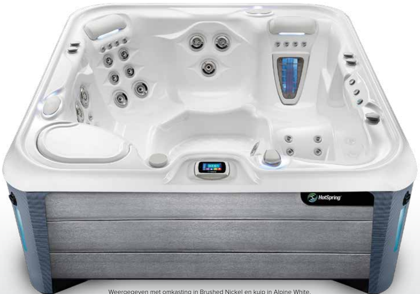
Weergegeven met omkasting in Brushed Nickel en kuip in Alpine White.

Onze ontwerpers selecteren zorgvuldig een verscheiden kleurenpalet met zes afwerkingen voor de omkasting en een waaier aan kuipkleuren zodat u een look kunt creëren die perfect bij u past.